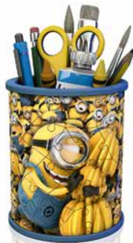
Pencil Holder - Despicable Me 3 No. 12 261 6

Ⓓ Dies ist ein internationaler Prospekt. Es ist daher möglich, dass nicht alle Produkte in Ihrem Land erhältlich sind. ⒸⒺ ⒺⒶ Some products shown in this international brochure may not be available in your country. Ⓕ Ce dépliant est international. Il est donc probable que tous les motifs ne soient pas disponibles dans votre pays. Ⓖ Questo è un catalogo internazionale, è quindi possibile che alcuni soggetti non siano disponibili nel vostro paese. Ⓗ Este es un catálogo internacional. Por eso es posible que algunos modelos no estén a la venta en su país. ⓃⒻ Dit is een internationale folder. Het is dus mogelijk dat niet alle motieven in uw land verkrijgbaar zijn.