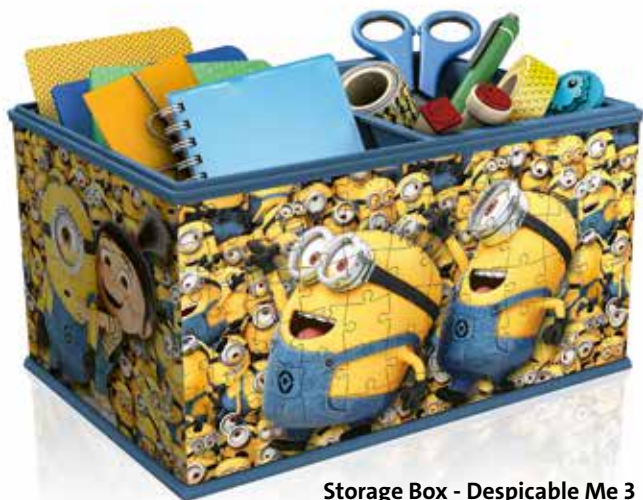
Storage Box - Despicable Me 3 No. 12 260 9